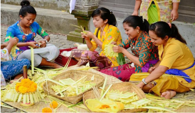
Gambar 1. Hubungan manusia dengan manusia/pawongan (hubungan harmonis antara kaum perempuan bali).