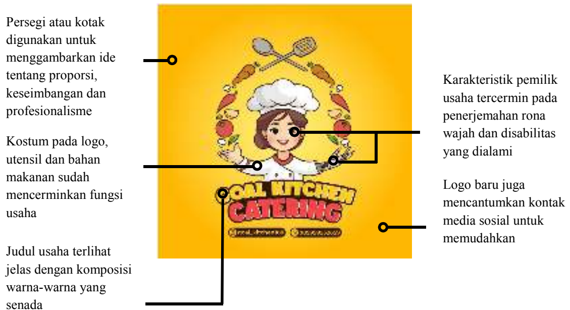
Gambar 3. Hasil Redesain Logo UMKM

Begitu juga pemilihan warna logo yang berbeda dengan logo awal. Jika logo awal dominan warna hijau yang melambangkan kesegaran makanan, maka logo baru dipilih warna kuning yang melambangkan kehangatan, keramahan dan kenyamanan. Karakteristik ini sesuai dengan yang dibangun oleh merek usaha. Melalui tanya jawab dan proses desain, diperoleh logo baru usaha catering anggota HWDI sebagai berikut: