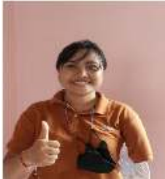
Gambar 2. Foto Diri Pemilik Usaha sebagai Inspirasi Logo

2011; Müller, 2013). Namun, mengingat durasi berdirinya usaha masih singkat dan urgensi penggantian logo mendesak, maka pergantian logo secara total sangat tepat.