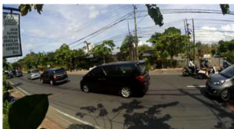
Gambar 1. Ruas Jalan Hang Tuah

Lokasi yang pilih dalam penelitian ini adalah Jalan WR. Supratman, Jalan Hang Tuah serta Jalan Tukad Yeh Aya alasan penulis memilih ruas jalan ini karena ruas jalan tersebut arus lalu lintasnya cukup padat, serta banyak jenis kendaraan yang melewati ruas jalan tersebut. Berikut adalah gambar lokasi penelitian.