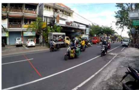
Gambar 2. Ruas Jalan WR. Supratman