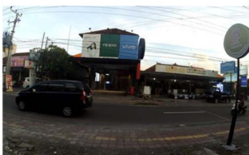
Gambar 3. Ruas Jalan Tukad Yeh Aya

Pemilihan waktu survei dilakukan pada jam sibuk pagi dari jam 06:30 s/d 08:30, jam sibuk siang 12:00 s/d 14:00 dan jam sibuk sore dari jam 16:00 s/d 18:00 Wita dan dilakukan pada hari Selasa, Rabu, Kamis karena dianggap dapat mewakili arus pada hari kerja.