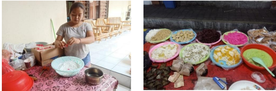
Gambar 1. Foto Situasi Mitra

Pandemi Covid 19 yang mengakibatkan rekanan dari Jajanan Bali Gek Evi tutup sehingga menurunkan omset sampai 50%. Sekarang ini penjualan hanya dilakukan di Pasar Agung dan menunggu pesanan pasif karena belum menggunakan pemasaran online.